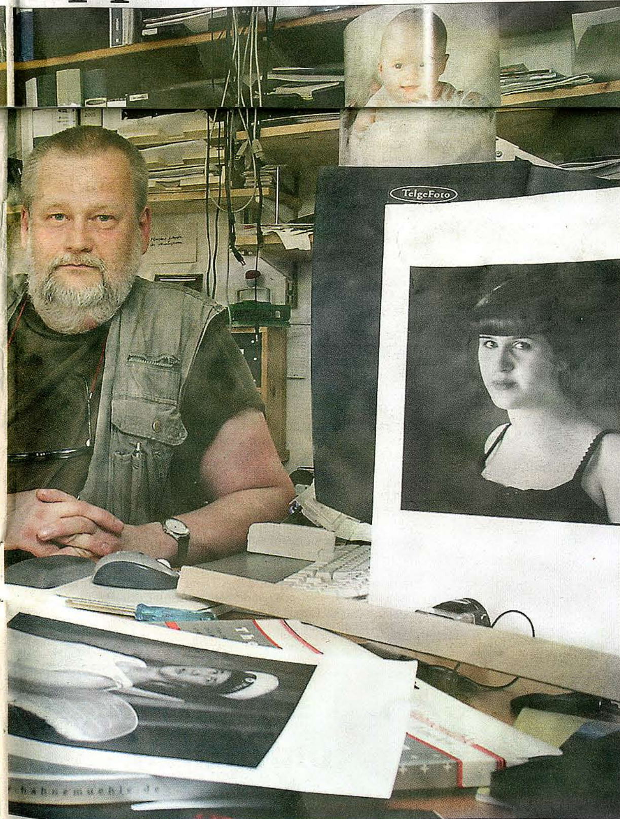
fotolärare och startat en skola. Bland mycket annat.